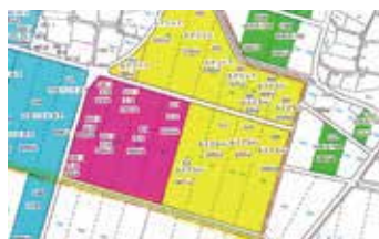
圃場の場所が明示された地図