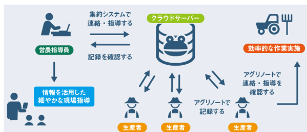
アグリノート概要

「アグリノート」と「アグリサポート」が連携することで、アグリノート上で農機の稼働情報・状態が見えることはもちろん、農機の稼働状況に応じた農作業記録を自動で保存します。本連携により、これまで敬遠されていた作業記録業務の労力を大幅に削減し、記録をつける手間を軽減します。さらに、データとして分析・活用できる記録の登録を通じて、これまで生産者の課題となっていた圃場1枚毎のコスト・品質・収量の見える化を実現します。