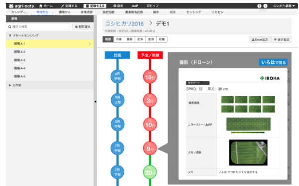
※開発中の画面イメージです。

アグリノートの実績確認機能にいろはの情報が加わります。作業実績や生育状況の記録に空から取得した情報が付き、その時々々の圃場の状態を管理できるようになります。作業と結果を時系列で把握することで、栽培の振り返りがより明確に行えます。