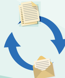
生産者へ情報を 一斉配信