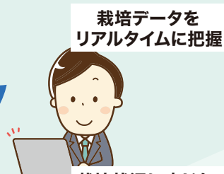
栽培状況に応じた 改善提案