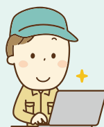
日々の記録が 提出書類に