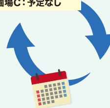
散布実績/進捗の確認 適否判定